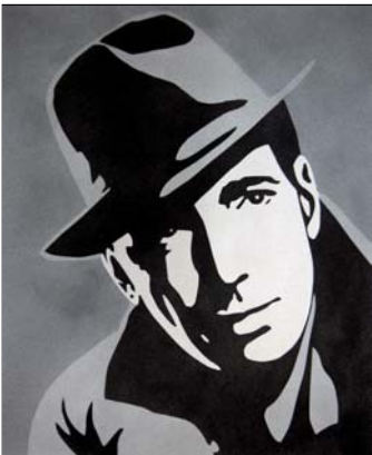
Ref. PRD-38 38x46 cm (8F)