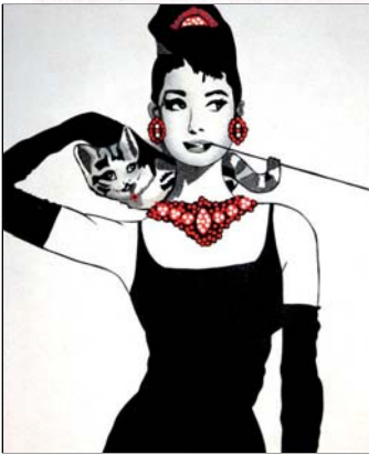
Ref. PRD-05 50x61 cm (12F)