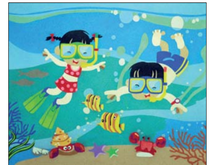
Ref. PRD-50 61x50 cm (12F)