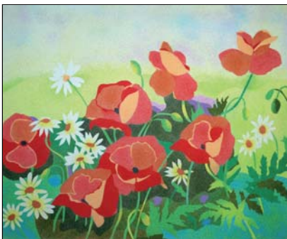
Ref. PRD-40 46x38 cm (8F)