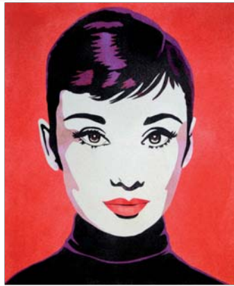
Ref. PRD-34A 50x61 cm (12F) Ref. PRD-34B 38x46 cm (8F)