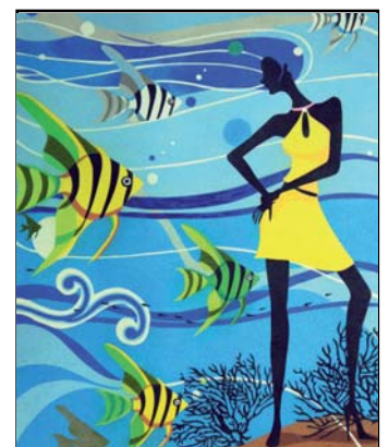
Ref. PRD-46 50x61 cm (12F)