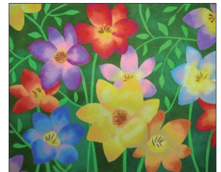
Ref. PRD-43 46x38 cm (8F)