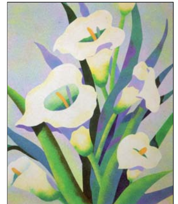
Ref. PRD-39 38x46 cm (8F)