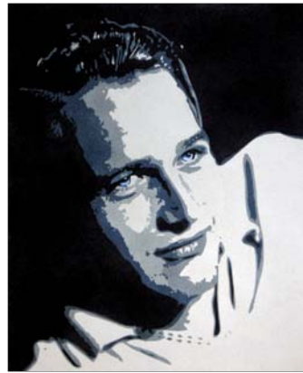
Ref. PRD-36 50x61 cm (12F)