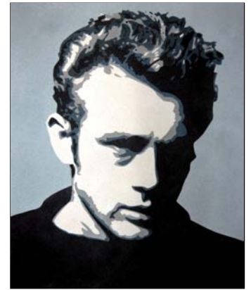
Ref. PRD-37A 50x61 cm (12F) Ref. PRD-37B 38x46 cm (8F)