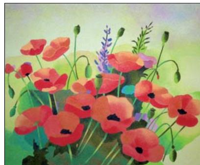
Ref. PRD-41 61x50 cm (12F)