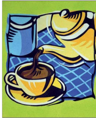
Ref. PRD-58 38x46 cm (8F)