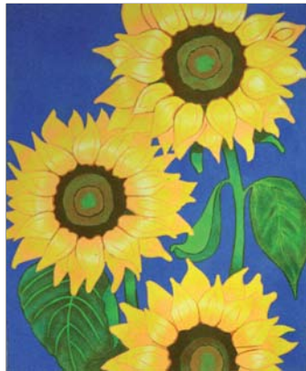
Ref. PRD-42 50x61 cm (12F)