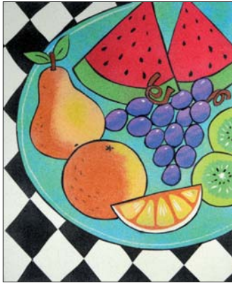
Ref. PRD-63 38x46 cm (8F)