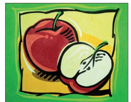
Ref. PRD-60 46x38 cm (8F)