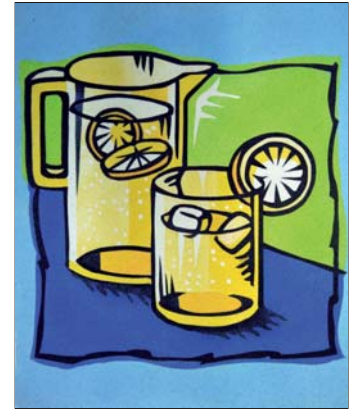
Ref. PRD-59 38x46 cm (8F)