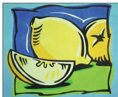
Ref. PRD-61 46x38 cm (8F)