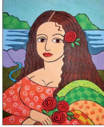
Ref. PRD-52 38x46 cm (8F)