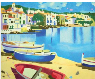
Ref. PRD-48 61x50 cm (12F)