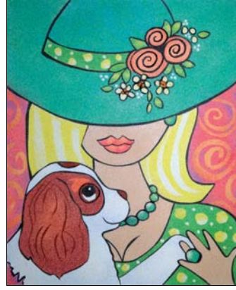
Ref. PRD-53 38x46 cm (8F)