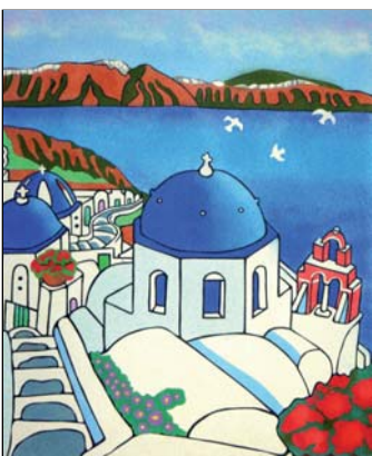
Ref. PRD-47 50x61 cm (12F)