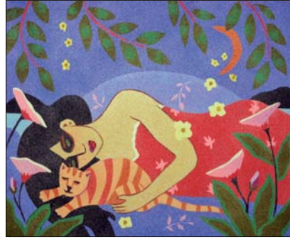
Ref. PRD-55 46x38 cm (8F)