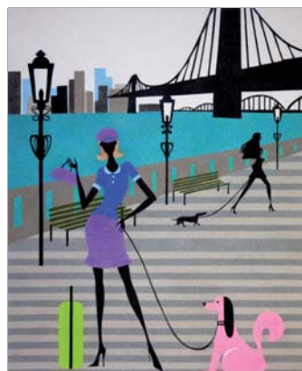
Ref. PRD-45 50x61 cm (12F)