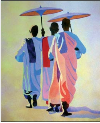
Ref. PRD-57 38x46 cm (8F)