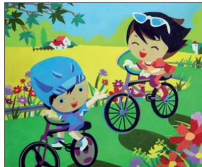
Ref. PRD-49 61x50 cm (12F)