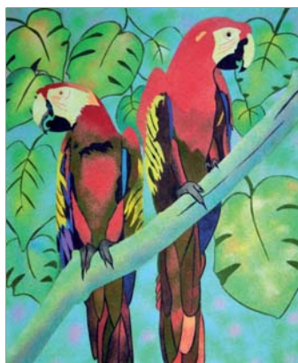
Ref. PRD-56 50x61 cm (12F)