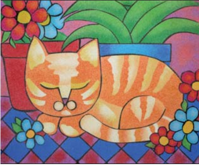
Ref. PRD-51 46x38 cm (8F)