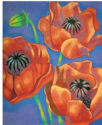
Ref. PRD-44 50x61 cm (12F)