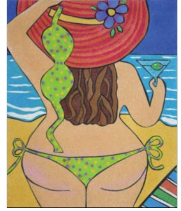
Ref. PRD-54 38x46 cm (8F)