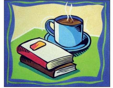
Ref. PRD-62 46x38 cm (8F)