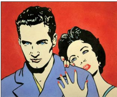
Ref. PRD-35 61x50 cm (12F)